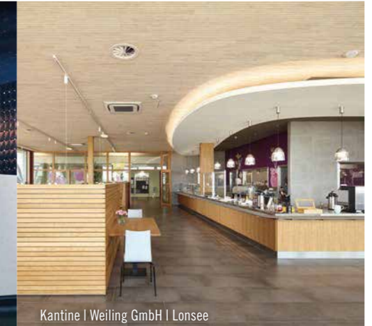
Kantine | Weiling GmbH | Lonsee