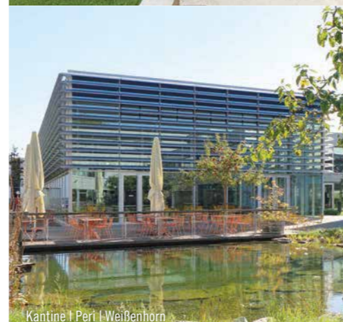
Kantine | Peri | Weißenhorn