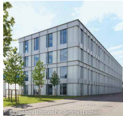
Bürogebäude | Uhlmann Pac-Systeme | Laupheim