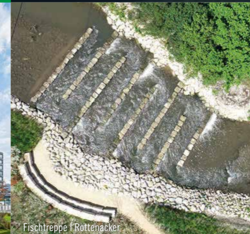
Fischtreppe | Rottenacker