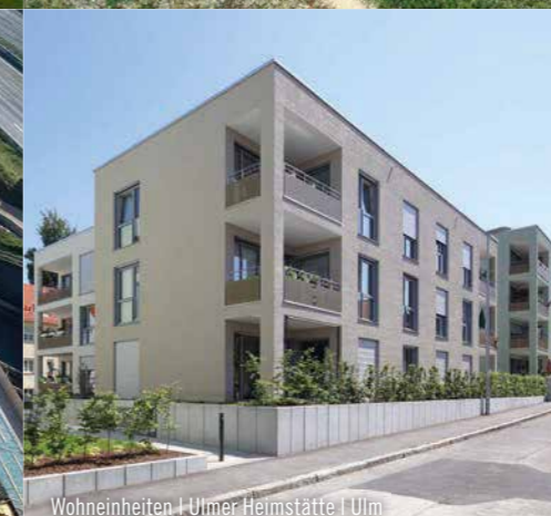
Wohneinheiten | Ulmer Heimstätte | Ulm