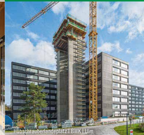
Hubschrauberlandeplatz | BWK | Ulm