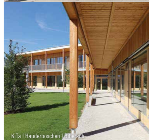
KiTa | Hauderboschen | Biberach