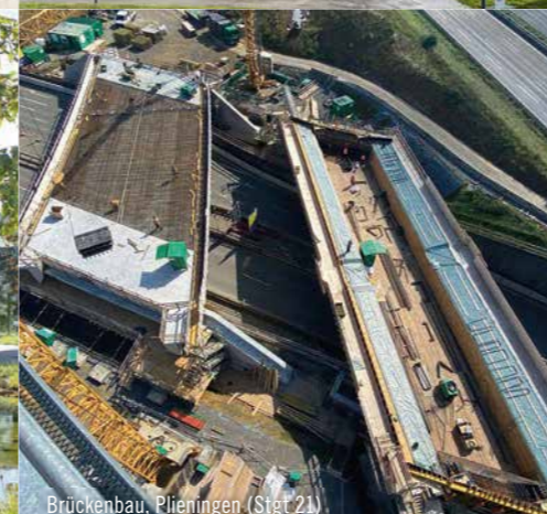
Brückenbau, Plieningen (Stgt. 21)