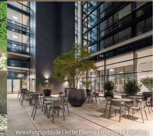
Verwaltungsgebäude | Vetter Pharma-Fertigung | Ravensburg