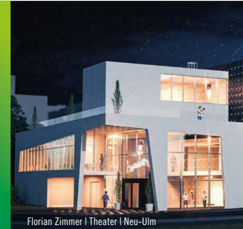
Florian Zimmer | Theater | Neu-Ulm