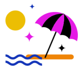
30 + 2 Tage Urlaub