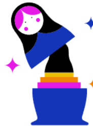
Moderner Tech Stack & innovative Projekte