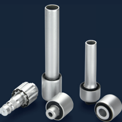
Produkte für die Automobilindustrie

Attraktive Ausbildungsvergütungen und zusätzliche Sozialleistungen runden unser Profil als Arbeitgeber ab.